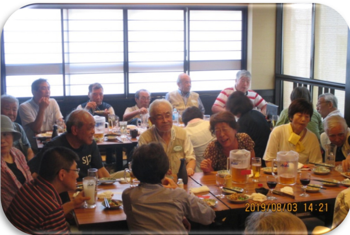
国分寺駅前 居酒屋「煙」での納涼会