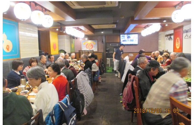
四谷 ミライザカでの忘年懇親会