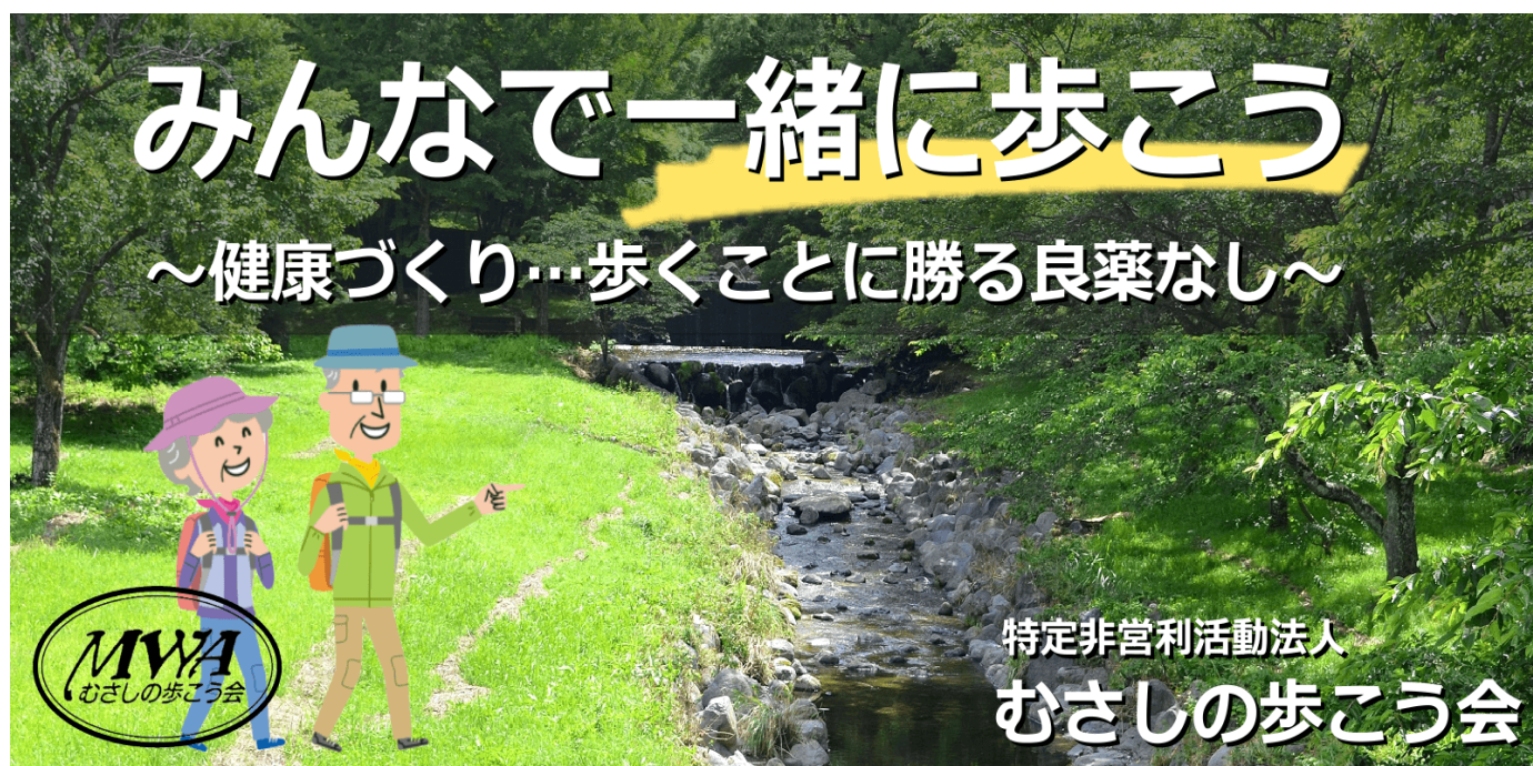
新ホームページの『ホーム』画面